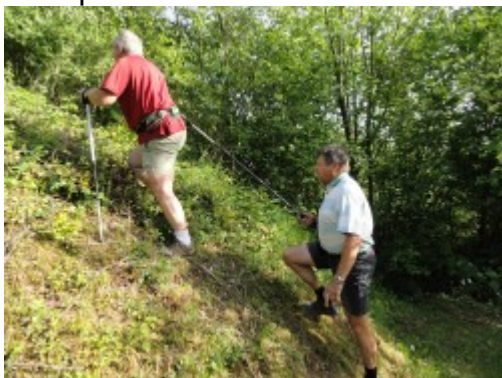
Gidssysteem voor slechtziende